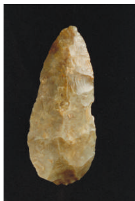
Bifaz de Cuarcita

Los carpetanos habitaron en estos parajes hasta muy entrada la dominación romana. La “romanización” de Carpetania no fue empresa fácil; llevó más de 200 años y trajo consigo levantamientos y sublevaciones de los aborígenes. Con la llegada de Octavio Augusto al trono del