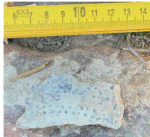
Detalle cerámica decorada encontrada al norte de la línea de alta velocidad.