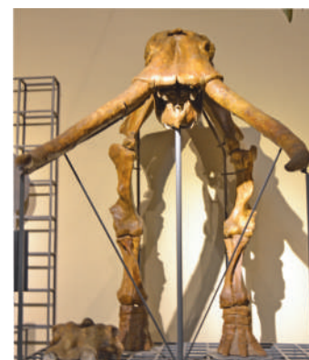
Esqueleto de Mamut en el Museo de Ciencias de Madrid