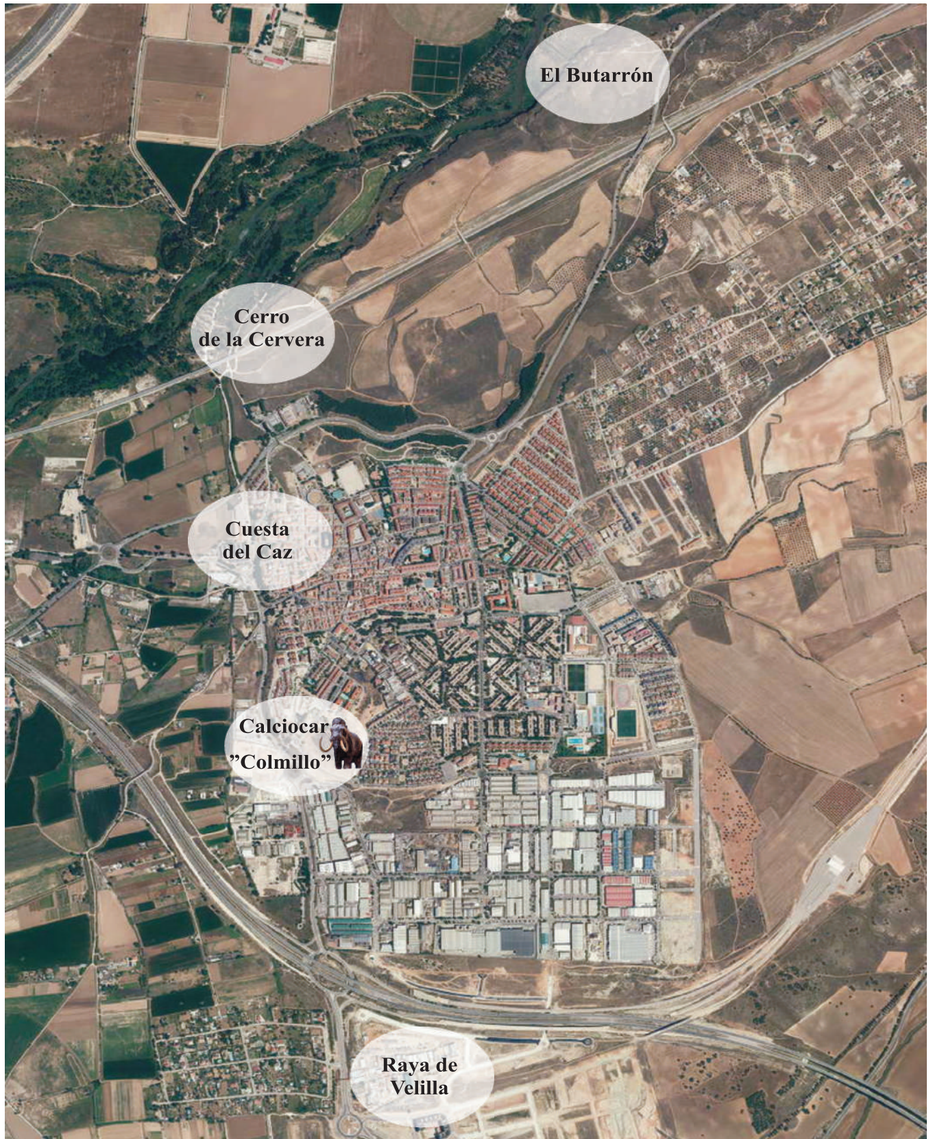
Plano de localización de los distintos asentamientos hallados en el termino Municipal de Mejorada del Campo